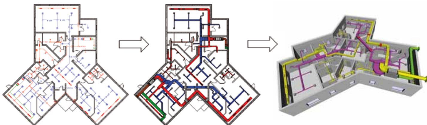
Dessin d'un réseau de ventilation en unifilaire pour dimensionnement et production automatique en bifilaire et 3D.

Les avantages sont nombreux et reconnus par les utilisateurs. Ce sont, par exemple, la facilité intellectuelle de représentation de la 3D et la flexibilité : un clic suffit pour créer ou supprimer une coupe. Il s'agit également de l'efficacité dans les situations délicates où un travail en isométrie deviendrait vite com-